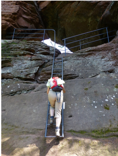
Büttelfels, Aufstieg freiwillig