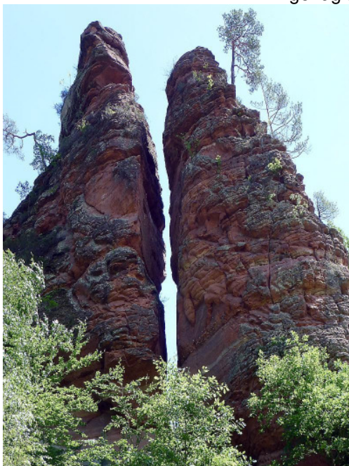
Braut und Bräutigam