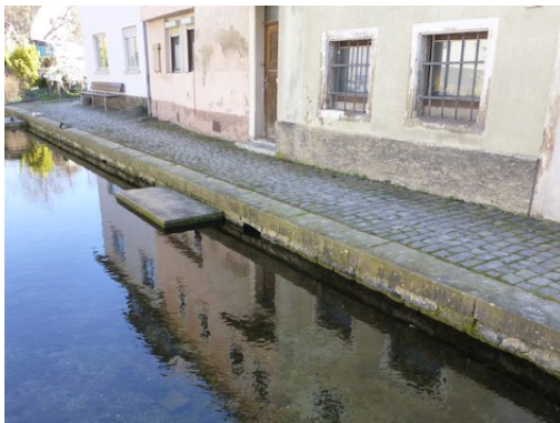
An der Seebach-Quelle

Die Wassertemperatur beträgt konstant 9 Grad. Nach der Quelle führt eine Treppe hoch zur Reipoldskircher Gasse. Auf der Ohligstraße biegen Sie links und dann gleich wieder rechts ab. Dieser Weg führt Sie „Hinter der Kirche“ direkt zum Parkplatz .